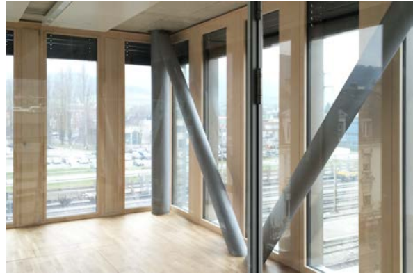
Détail passage de dalle